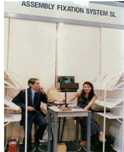
En el Salon de Inventores "GENIAPOLIS" de Valencia – Mayo 2002

Le planteo un breve cuestionario y ríe en la complicidad. “A ti no te voy a decir que no” ,,